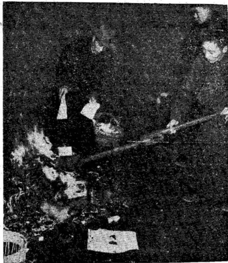
Čiangkaišeko valdžios darbininkai degina dokumentus, kad nepatektų į komunistų rankas. Pati valdžia išdūmė į Kantoną, palikusi tiktai prezidento pavduotoją. Sako komunistai koncentruojasi Nankingo ėmimui.

Susikirtimas Euro poje tarp valstybės ir bažnyčios