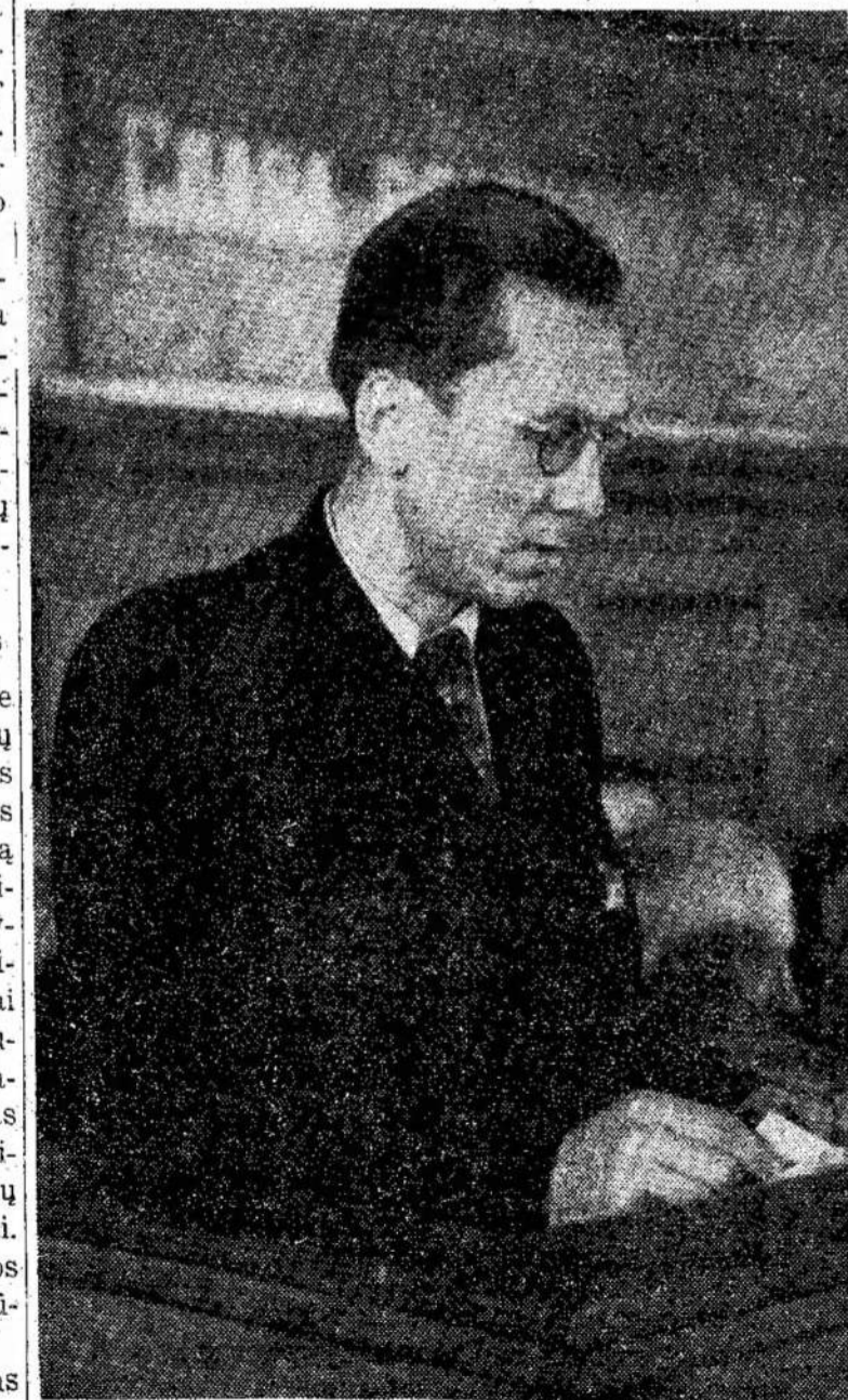
Vytautas Sirijos Gira

Lietuvių tautos gyvenimas, kupinas kuriamojo ir džiuginančio darbo, turėjo didelę įtaką ir mano literatūrinei