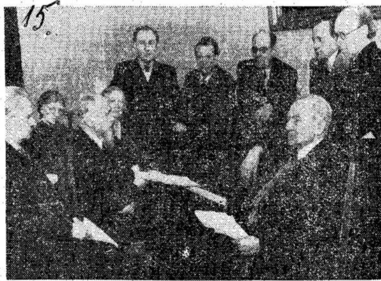
Pagyvėjęs kultūrinis veikimas Pabaltijo respublikose pareikalavo iš kultūrininkų daugiau darbo. Nuotraukoje — Latvijos kompozitorių grupė, jų tarpe (prie fortepijono) kompozitorius prof. Alfredas Kalniņš, diskutuoja prieš juos stovinčias užduotis.