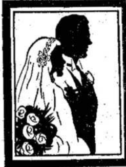
A. GARBENIS Fotografas

Savininkas Ch. Pampalas Telefonas: 46917