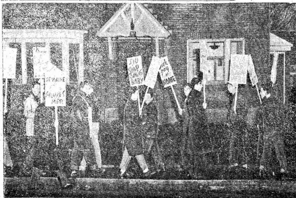
Kanados Jūrininkų Unijos nariai surengė demonstraciją prie transportacijos mi-

nistro namų Cornwall mieste. Kaip žinia, šeši jūrininkai buvo pašauti nuo val-