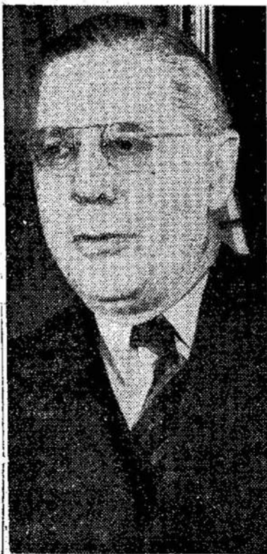
Hon. Leslie Frost, naujas Ontarijos premjeras.

Ickes daro šią išvadą: Amerikai nėra reikalo bijotis išdavystės šalies viduj. Amerikai ir išlauko pusės, numatomoj ateityj, nėra pavojaus. Didžiausią pavojų Amerikai sudaro reakcininkai — Krugai, Harrimanai ir Royallai.