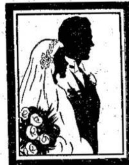
A. GARBENIS Fotografas

Savininkas Ch. Pampalas Telefonas: 46917