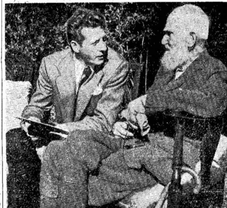
Danny Kaye, garsusis Jungtinių Valstijų jūdžių komedijantas, pas Bernardą Shaw, pasauliniai pagarsėjusį britų dramaturgą. Danny Kaye labai patikęs jam.

Einu link traukinio. Štai stotyje ant sienos marmurinė lenta, lenta, kurią praeinūs kasdien: St. Lazare stoties darbininkų, kritusių karių ir nacių sušaudytų at-