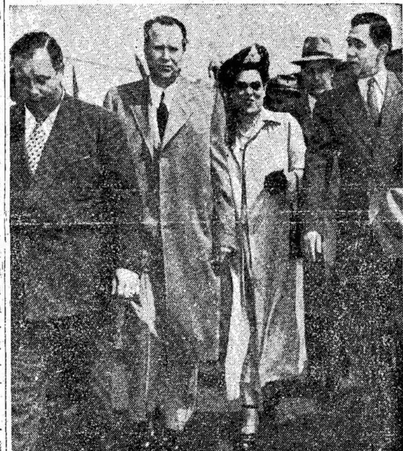
Andriejus Gromyko (dešinėje) ir kiti Tarybų Sąjungos atstovybės nariai Washingtono nutraukti jiems išvykstant į Maskvą pasitarimams. Spėjama, kad pasitarimo reikalą iššaukė prasidėjusi keturių didžiųjų konferencija.

Jei taip sklandžiai eis toliau, konferencija duos gerus vaisius.