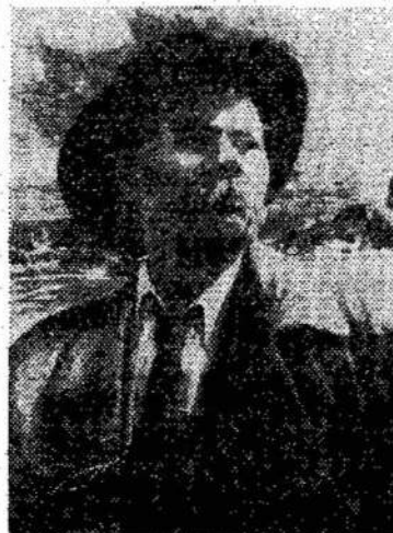
Garsaus tarybinio dailininko T. Brodskio pieštas M. Gorkio portretas.

Per tris dešimtmečius su trupučiu metų, praėjusių po Didžiosios Spalio revoliucijos tarybinę literatūrą į savo dėmesio diapazoną įtraukė pačias tolimas daugiasacionalinės Rusijos sritis. Prie rusų rašytojų prisidėjo gausingi Ukrainos, Baltarusijos, Gruzijos, Armėnijos, Kazachijos, Uzbekijos, Latvijos, Estijos, Lietuvos žodžio mėnininkų būriai. TSR Sąjungos broliškujų respublikų rašytojai — prozaikai ir poetai — kiekvienas savo gimtąja kalba sukuria veikalus, vieningus savo idėjine tendencija ir su jų rusų kolegų veikalais. Meno veikalai su-