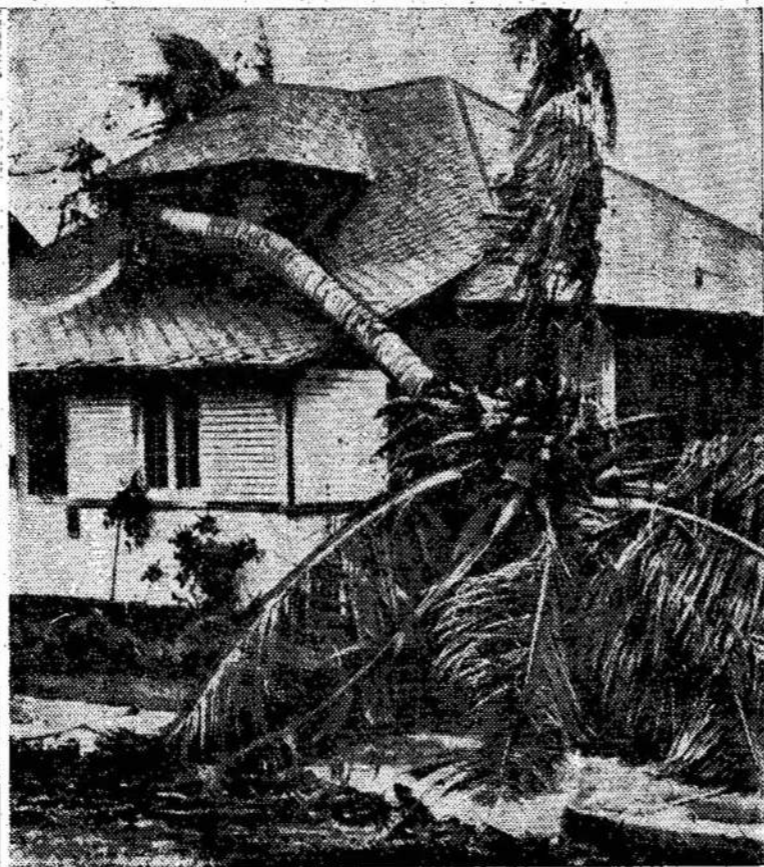
Nesenai Floridos pakraštį užmestas medis ant namų nuteriojo smarkus viesulas, Palm Beach mieste, Floridoj. Viesulas apgriovė daugelį pastatų.