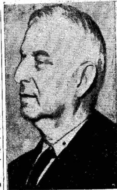
Buvęs vokiečių generolas Erich von Manstein, kurs dabar teisiamas Hamberge. Jis kaltinamas naudojime tarybinių belaisvių rinkimui mišnių ir nužudyme 10,000 žydų. Jis buvo vienas iš ištikimiausių Hitlerio generolų. Ciorčilas jo gynimui aukojo $100.

Mes kviečiame visus LLD narius Kanadoje platinti demokratinę liaudies spaudą, kaip savaitraštis Liaudies Balsas, dienraščiai Laisvė ir Vilnis, ir remti ją visais galimais būdais, nes jie yra geriausi darbo žmonių įrankiai kovoje už geresnį gyvenimą, už demokratines liaudies teises, už taiką ir laimę.