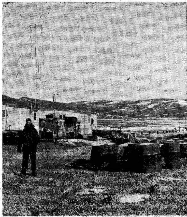
Kanada ir Jungtinės Valstijos turi visą eilę oro stočių Cornwallis salos, arti asigatoli šiaurėje. Nuotraukoj — liū.