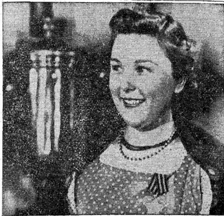
Scena iš tarybinės filmos "Symphony of Life", kuri bus rodoma King Teatre, Toronte, pradedant spalio 10 dieną. Filma vaizduoja gyvenimą Sibire.

Praėjusį šeštadienį atsibuvo Bangos choro šokiai su įvairiais pamarginimais. Publikos buvo nemažai, visi gražiai ir linksmai praleidome vakarą. Tikiuosi, kad Bangos choras turės daugiau tokių parengimų. Tad stokite į