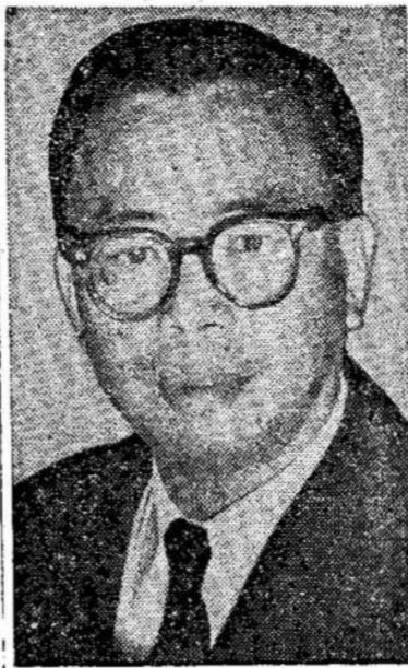
Dr. Tingfu S. Tsiang, Čiang Kai-šeko atstovas Jungtinėse Tautose. Jis verkia, kad rusai kalti, kad Kinijos liaudis varo lauk jo valdžią. Jis duoda skundą Jungtinėms Tautoms, bet atrodo, kad nėra didelio ūpo imti jo skundą.