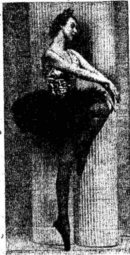
LOUISE BURNS, ballet Toronto