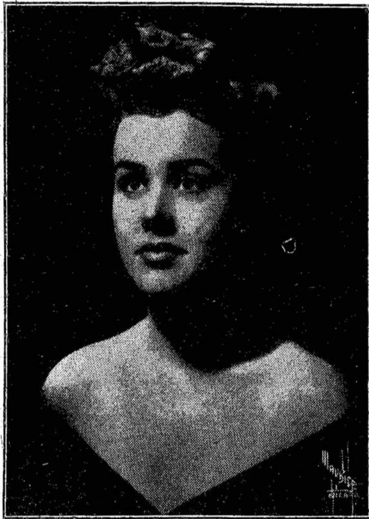
SYLVIA PRAN, soprano Toronte ir Montreale