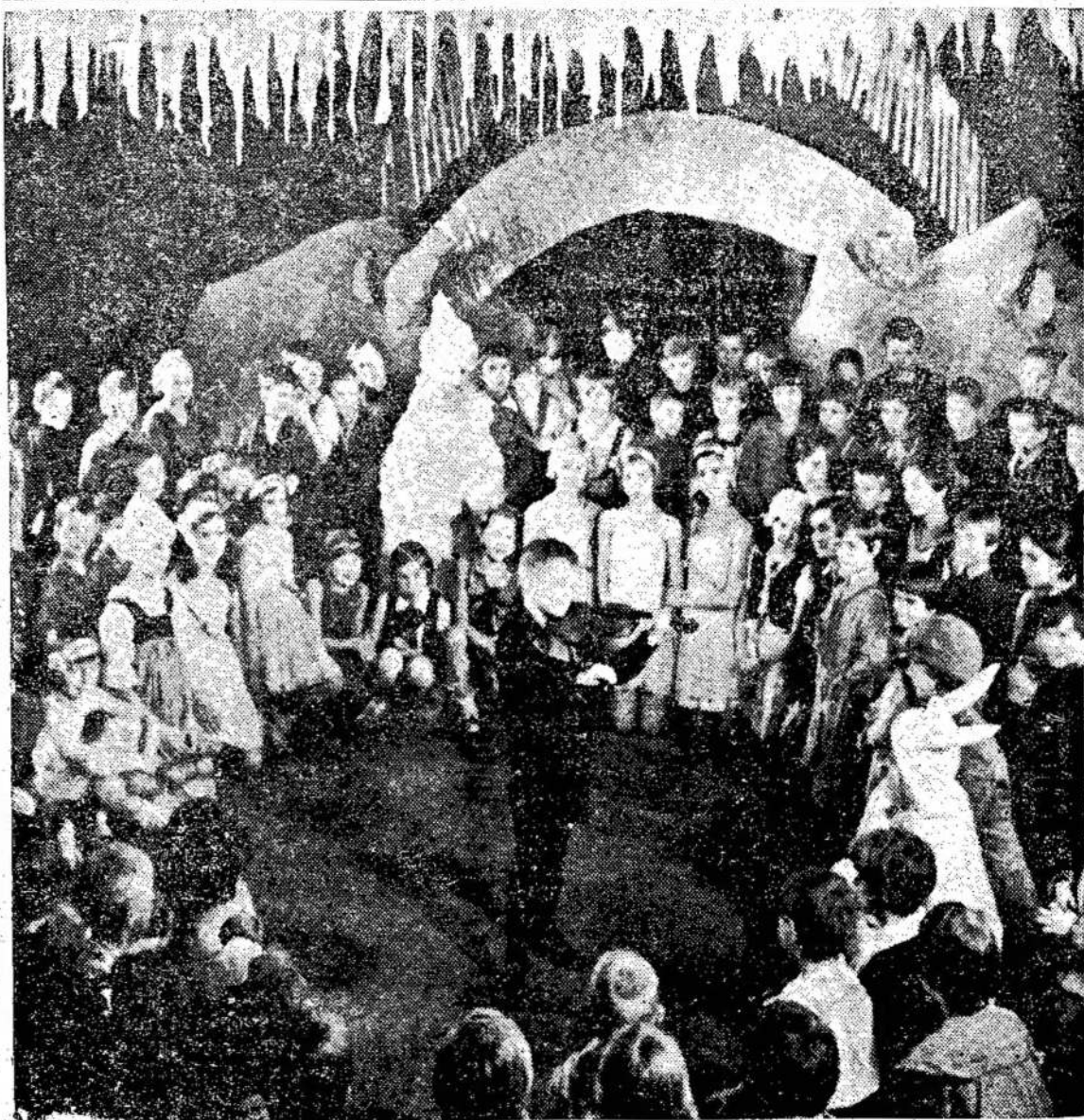
Tarybų Sąjungos vaikučiai, jai ji rengiama per naujus metus. Nuotraukoj — vaikučiai prie eglaitės Leningrade.