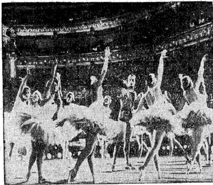
Scena iš tarybinės filmos College ir Manning, pradedant sausio 9 dieną. Bus rodoma King teatre, kamps rodoma tik vieną savaitę.