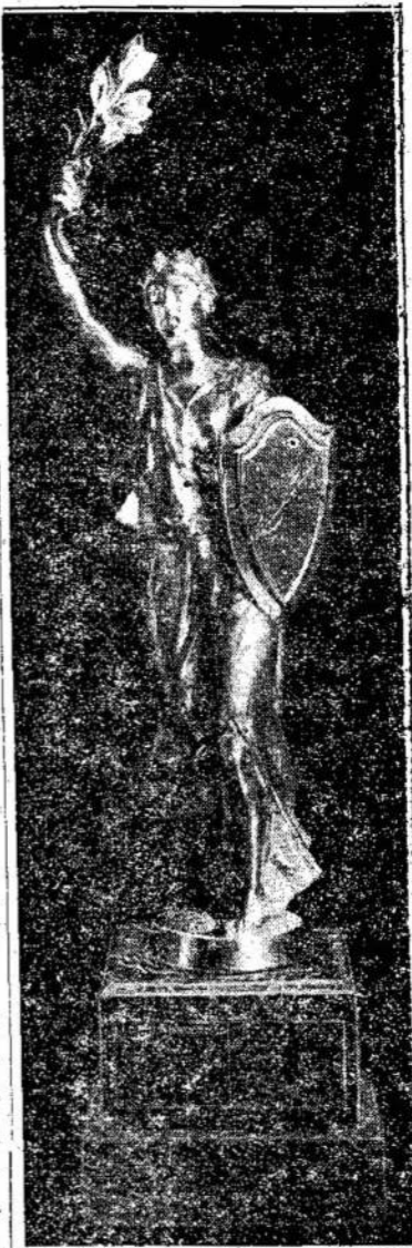
Liaudies Balso Trofėja, kurią praėjusiam vajuje laimėjo LLD Pirmas rajonas su Montrealu priešakyje.