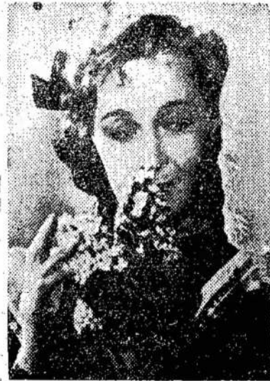
Vera Maretskaja, tarybinės filmos "Kaimo Mokytoja" žvaigždė. Filma rodoma King teatre, Toronte.