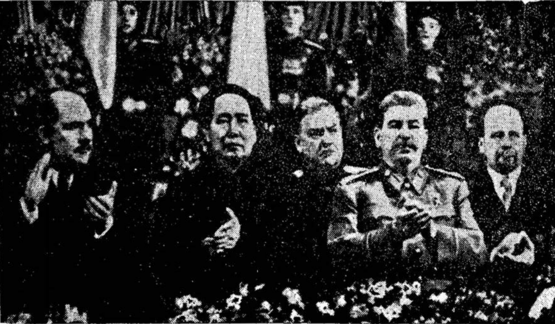
Mao Tse-tungas, naujosios Kinijos lyderis, buvo labai draugiškai sutiktas, kuomet jis pasirodė Tarybų Sąjungos sostinėje Maskvoje laike

Iš amerikiečių šaltinių prasadėjo gandai, kad Vengrijos valdžia ketina sulaukyti baltos duonos pardavinėjimą; kad ji esanti pardavinėjama