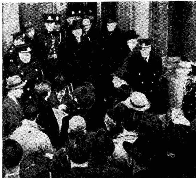
Ottawos policija sulaiko bedarbių konvencijos delegaciją prieš parlamento rūmų. Ji neleido bedarbių konvencijos delegacijai įteikti savo memorandumą premjerui.