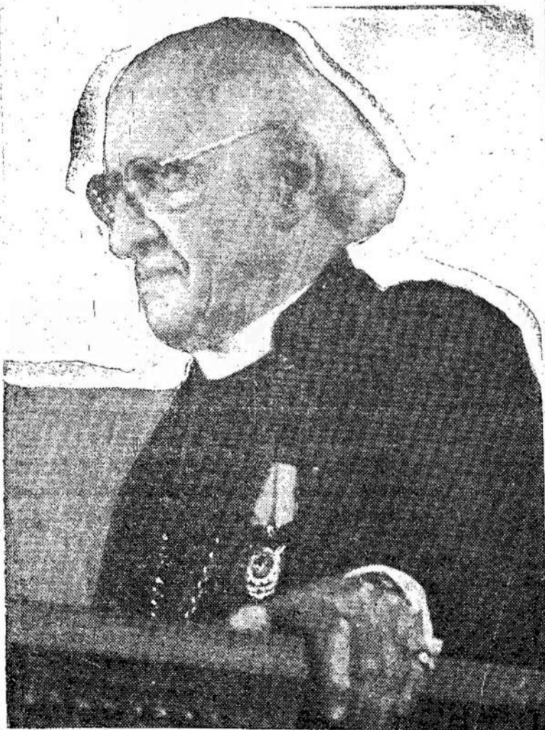
Dr. Hewlett Johnson, Kanterburio dekanas, uolus kovotojas už taiką ir progresą.

Iš Kvebeko provincijos tikimasi turėti nuo 250 iki 300 delegatų. Penkiolika jaunuolių pasimainydami, neš taikos torčių visu keliu nuo Montrealo iki Toronto. Toronte juos pasitiks Toronto ir kitų vietų jaunieji delegatai.