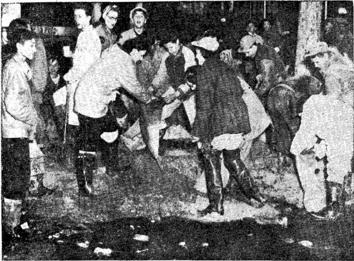
Winnipegas jaunimas pasirodė didvyriškai, kuomet kilo reikalas kovoti su potviniu. Nuotraukoj — pažangiečių ukrainiečių jaunimas pila maišus smėlį užtvarams budavoti. Ukrainiečių svietinėse paverstos potvinio kovotojų koncentracijos punktais.