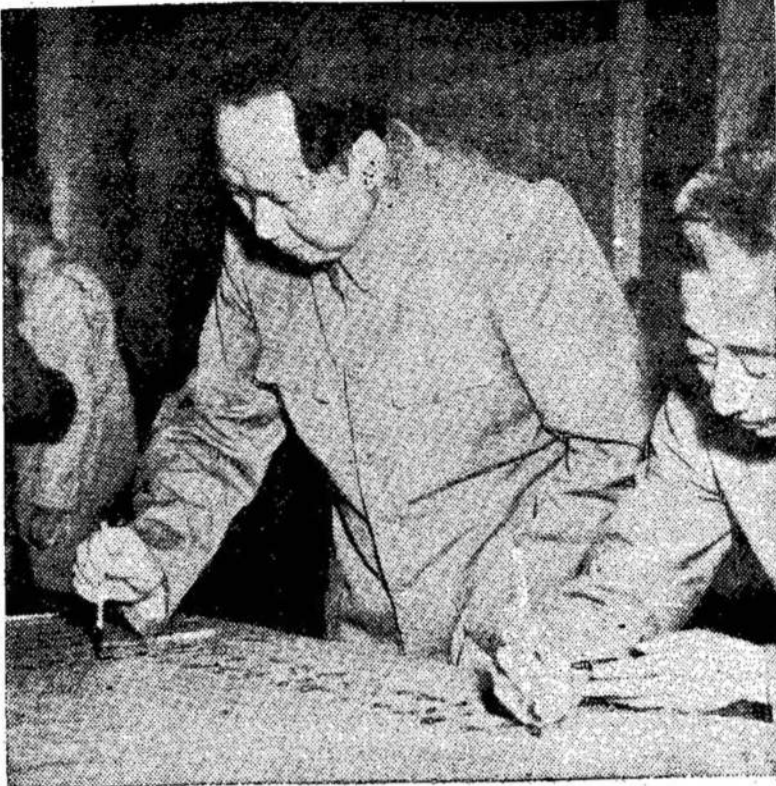
Mao Tze Tung, Kinijos Liaudies Respublikos Centralinės Valdžios pirmininkas, pasira-

Nežiūrint, kaip į tai anglosaksai žiūri, bet Kinijos žmonės tai supranta, kaip