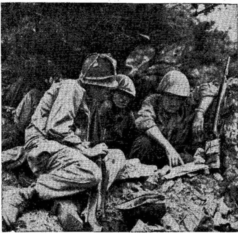
Amerikiečiai komandieriai, partizanai nesunaikintų iš pasislėpę po medžiu, žiūri užpakalio. Panašiai jie pabėžemėlapi. Amerikiečiai dažgo, palikę kanuoles, pietiniai būna priversti neštis, kad me fronte tik šiom dienom.

Visuomet geriau apsisaugot jų iš anksto, su kokiais skiepais ir priešnuodžiais. Influenza virus vaccine dau-