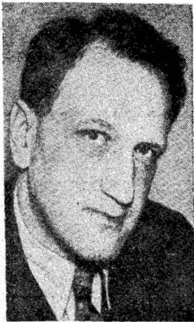
Profesorius Leopold Infeld, vienas iš profesorius Einsteino mokinių ir bendradarbių, kurs aną dieną pranešė iš Lenkijos, kad jis rezignuoja iš Toronto universiteto ir pasilieka dirbti Lenkijoje, kur jis gimė ir augo.

Senoj Lenkijoje jam, kaip žydui, buvo uždarytas kelias į universitetą. Viskas, ką jis galėjo gauti, tai gimnazijos mokytoju žydui gimnazijoje. Dabar jis bus vienas iš aukščiausių mokslininkų.