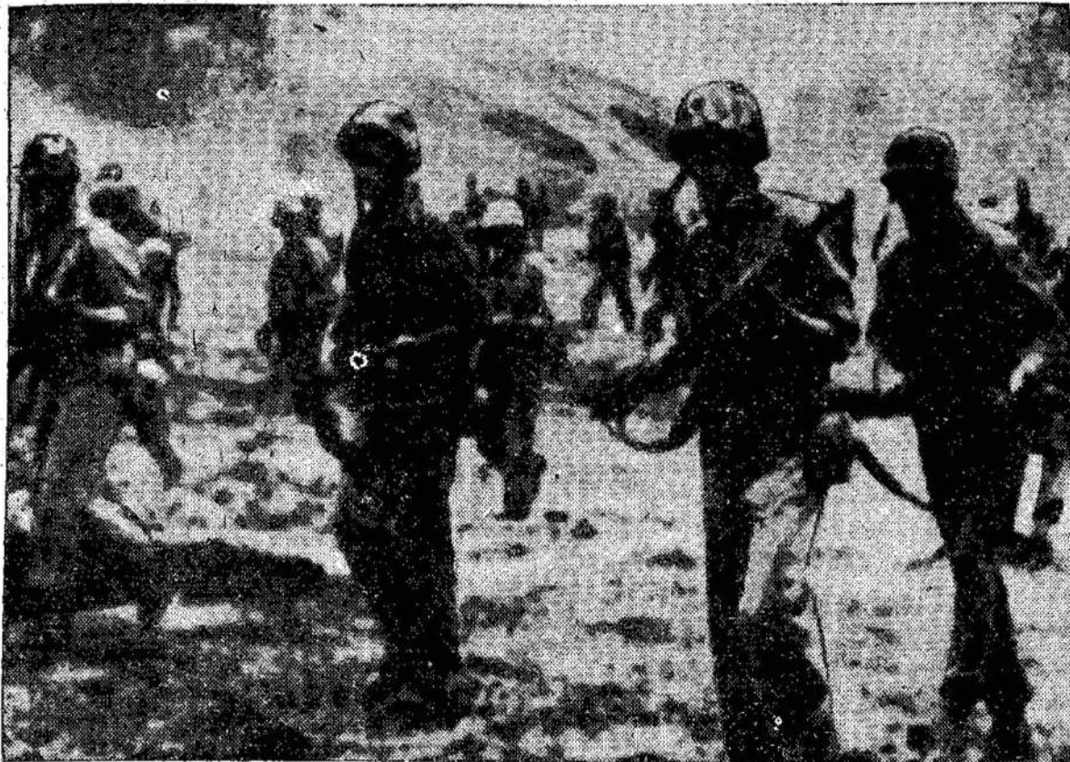
Amerikiečiai išsikelia Incho- sikeldami, jie pastatė į keblia Korėjoj. Virš 250 laivų da- ne, netoli nuo Seoulo. Ten iš- padėtį korėjiečių jėgas Pietų lyvavo iškėlime 40,000 karių.