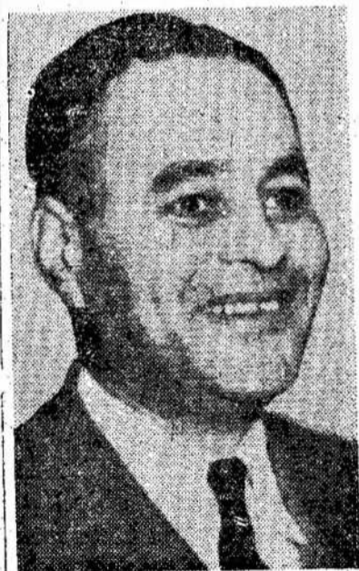
Dr. Ralph Bunche, arabų ir žydų taikytojas Palestinoje, kurs šiomis dienomis buvo apdovanotas Nobelio taikos dovana. Sakoma, kad pirmas negras laimėjęs tą dovana.

HOUSTON. — Amerikos Darbo Federacijos narių skaičius sumažėjo visu 100,000. Buvo planuota gauti 1,000,000 narių, bet išėjo priešingai. Atrodo, kad lyderiai, vesdami vaju prieš pažangiuosius, užmiršo savo vaju naujų narių gavimui.