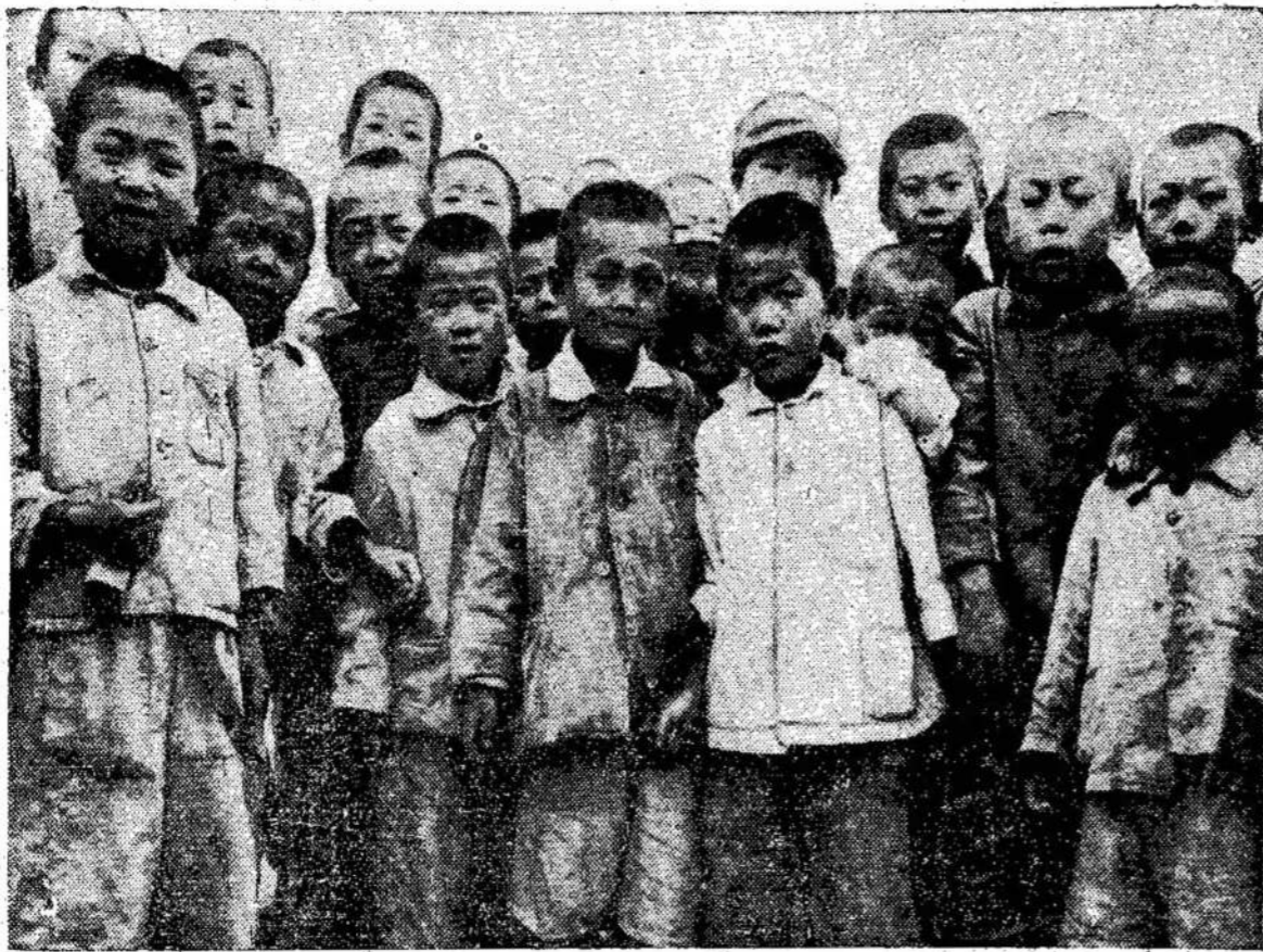
Dešimtys tūkstančių Korėjos vaikučių liko pašalčiaisiais pasekoj karo, kurį iššaukė Pietų Korėjos reacionieriai, dabar Jungtinių Tautų rąkose. Nuotraukoj matote ameriekių globojami, kaip rodo sučiupti dokumentai, mažą grupę našlaičių.