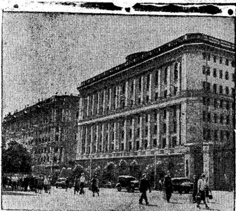
Nauji namai ant Gorkio gatvės Maskvoje. Juose gyvena darbininkų šeimos. Visoje šalyje didžiausia statyba visokių pastatų, kaip raportuoja vizitoriai. Niekas nepastebė prisirengimo karui, ar baimės karo.