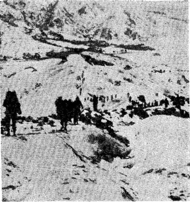
Korėjoj dabar gili žiema. Sakoma, kad 10,000 amerikiečių karių buvo išmušta iš kovos lauko "generolo šalčio" pastangomis.