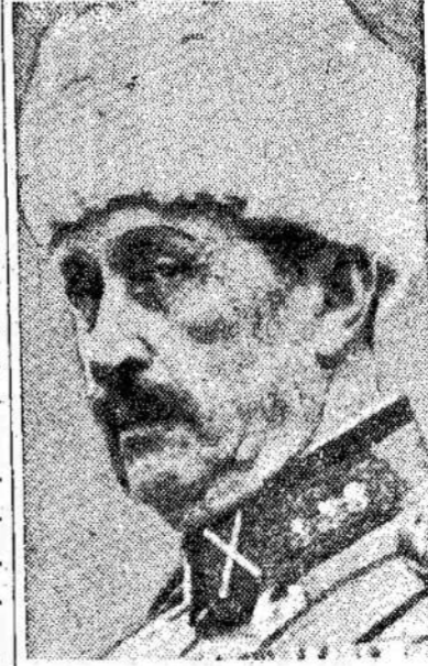
Feldmaršalas Baron Carl Gustav Mannerheim, Suomijos Plechavičius, mirė Šveicarijoje nuo širdies atakos. Jis buvo jau 83 metų amžiaus.

reiškime jie kritikuoja britų valdžios užsienio politiką pastaruosiuoju laiku, taipgi ir amerikiečių politiką sąryšyje su Formosa ir Japonija.