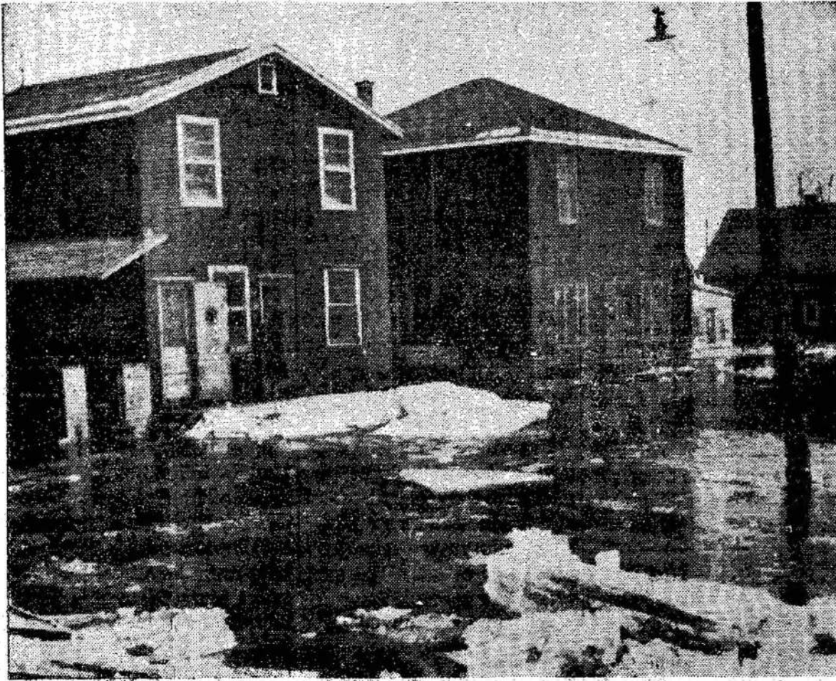
Tai ne Winnipegas pernai, o upės, užliejo vanduo. Montrealas šiame. Susigrūdus ledams ant St. Lawrence