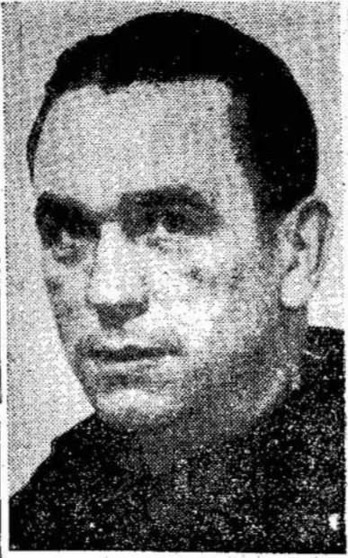
Generolas Kurt Meyer, 1945 metais nuteistas sušaudyti už atsakomybę už sušaudymą 114 Kanados belaisvių, vėliau įkalintas iki gyvos galvos New Brunswicke, dabar prašo valdžios pasigailėjimo.

Bet už keliolikos minučių atskrido keliolika bombnešių. Iš karto manėme, kad jie taip sau kur skrenda, bet kada jie pradėjo sukti ratu virš mūsų galvų, supratome kamė dalykas. Laukti jau nebuvo ko. Reikėjo slėptis. Pastatė savo vežimus ir atrėmė, kad jie nenuridėtų pakalnėn, slėpėmės, kur kas imanydami. Nespėjus baigti darbo su vežimais, pradėjo kristi bombos. Sudrebėjo miškas, virš mūsų pasipylė medžių šipuliai, žemių šmotai, akmenys. Bombų sprogimai susiliejo į vieną garsą ir atrodė kad visi kalnai dreba. Tas bombardavimas tęsėsi gal pusę valandos laiko.