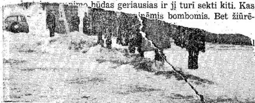
Meafordo ir St. Vincent miesteliai bendrai pasistatė bendruomenės centrą, kur dabar atliekama daug kultūrinio darbo. Nuotraukoje — dabar jamė raug. minimas bendruomenės centras ir grupė veikal.

Amerikiečiai giriasi, kad jų šalis demokratiškiausia, geriausias ir ji turi sekėti kiti. Kas žiūrės bombomis. Bet žiūrė-