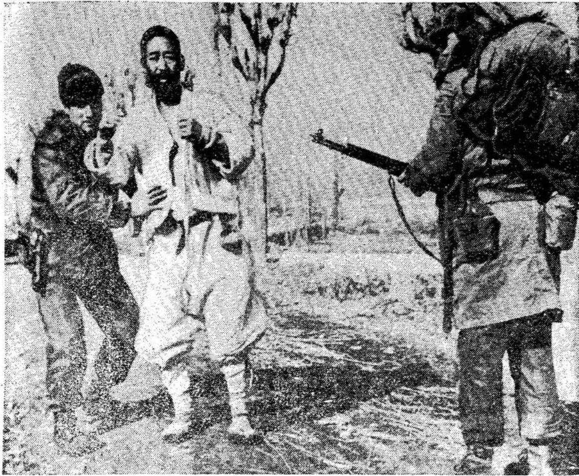
Jungtinių Tautų kareiviai apkenčia savo "gelbėtojų", krečia seną korėjietį, ieškodami ginklų. Korėjiečiai nepasitiki jais, krečia kur tik dažnai juos apsaudo, tad juos sutinka, kad neturėtų ginklų.