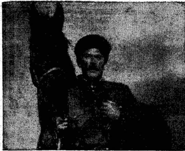
Scena iš naujausios tarybinės filmos "Cossacks of the Kuban" (Kubano kazokai). Ši filmą bus rodoma King Theatre, Manning ir College Toronte, pradedant kovo 23.