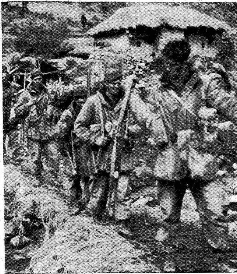
Kanadiečiai Korėjoje. Jie ieškia pirmiau ar turėję reikalų. Užėjus pavasariui, teks pasas? Jie nėra niekad matę jo braidyti purvyną.