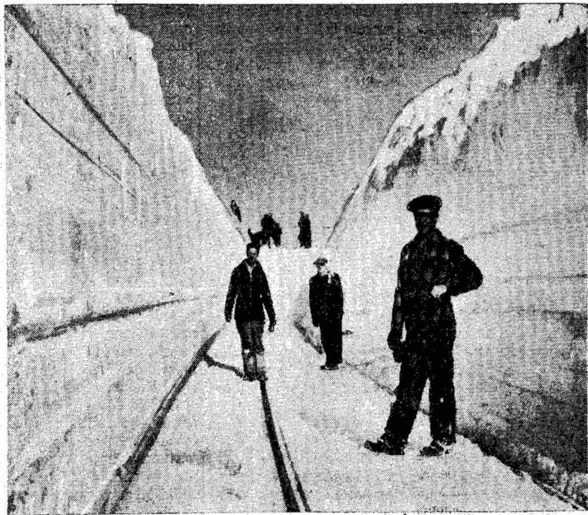
Albertos provincija sutiko pavasarį (pagal kalendorių) kasdama sniegą. Sniego pū-

gose žuvo devyni asmenys. Kai kur traukiniai buvo užpustyti. Nuotraukoj matote