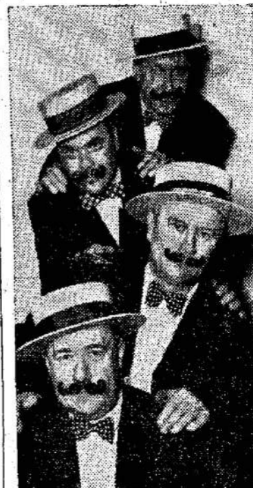
"Barbershop Quartet", kuris dainuoja ant radio senoviškas dainas. Juos galima girdėti pirmadieniais nuo 7 valandos vakaro.

WASHINGTON. — Argentina ir Guatemala atsiskė priimti Jungtinių Valstijų pasiūlymą dėl apsiginklavimo bendram apsigynimui. Jungtinės Valstijos nori, kad Pietų Amerikos šalys ne tik savo pakraščius patruliuotų, bet ir pasiųstų kariuomenę į kitas sritis, jeigu būtų reikalas.