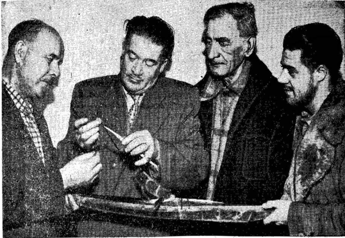
Prospektoriai apžiūri geležies rūdą, kurią surado James Bay distrikte. Manoma, kad tenai yra dideli tos rūdos klodai. Vis daugiau ir daugiau turtų Kanados po-

ma, kad tenai yra dideli tos rūdos klodai. Vis daugiau ir daugiau turtų Kanados po-