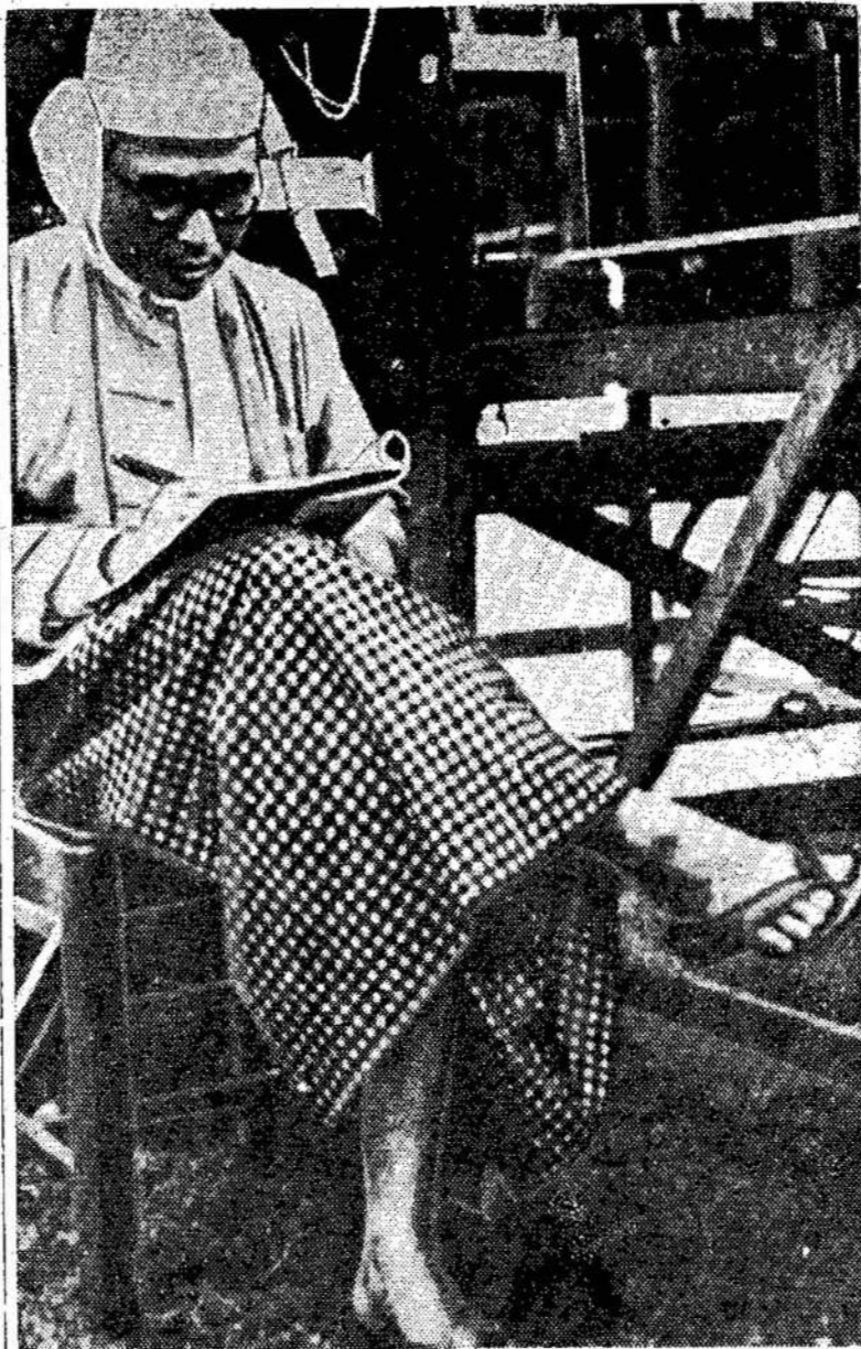
Kanadoje moterys pradeda nešioti kelines, bet kitur vyrai pradeda nešioti sijonus. Štai Burmos nacionalistų premjeras Takin Nu, kurs nešioja sijoną.