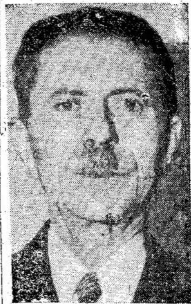
Irano premjeras Hussein Ala, kurs atmetė britų protestą dėl nacionalizavimo aliejaus šaltinių. Irane plečiasi žmonių judėjimas prieš svetimuosius, kurie valdo nemažus Irano turtus.

Štai į kokią "troiką" pateko kadaise buvę socialistai! Fašizmo apologetai uždraus jiems ir prisiminti kruvinąją Smetonos puotą Kaune 1926 metais. Sušaudytiesiems nekaltiems žmonėms, anot to kryžiočių ainio, nedaro jokio skirtumo ar juos sušaudė fašistai, ar būtų sušaudė socialistai, ar net kunigas. Bile tik budelis savo darbą "atliko profesionališkai"! — Vilnis.