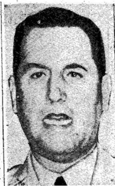
Argentinos prezidentas Juan Peron. Jo pasekėjai siūlo skirti jam Nobelio šovaną už „justicialistinius principus“. Tuo tarpu Jungtinėse Valstijose ir Kanadoje yra skelbiama gedula dėl uždaryto La Prensa laikraščio.

Bengalijos provincijos Asamblijos apskrityje salėje vyko eilinis posėdis. Švelni elektrinių sietynų šviesa apšvietė baltas indų-kongresininkų ir juodas musulmonų kepuraites. Salės centre, priešais spikerio krėslą, buvo susėdusi didelė deputatų-anglų grupė. Ant sienos ka-