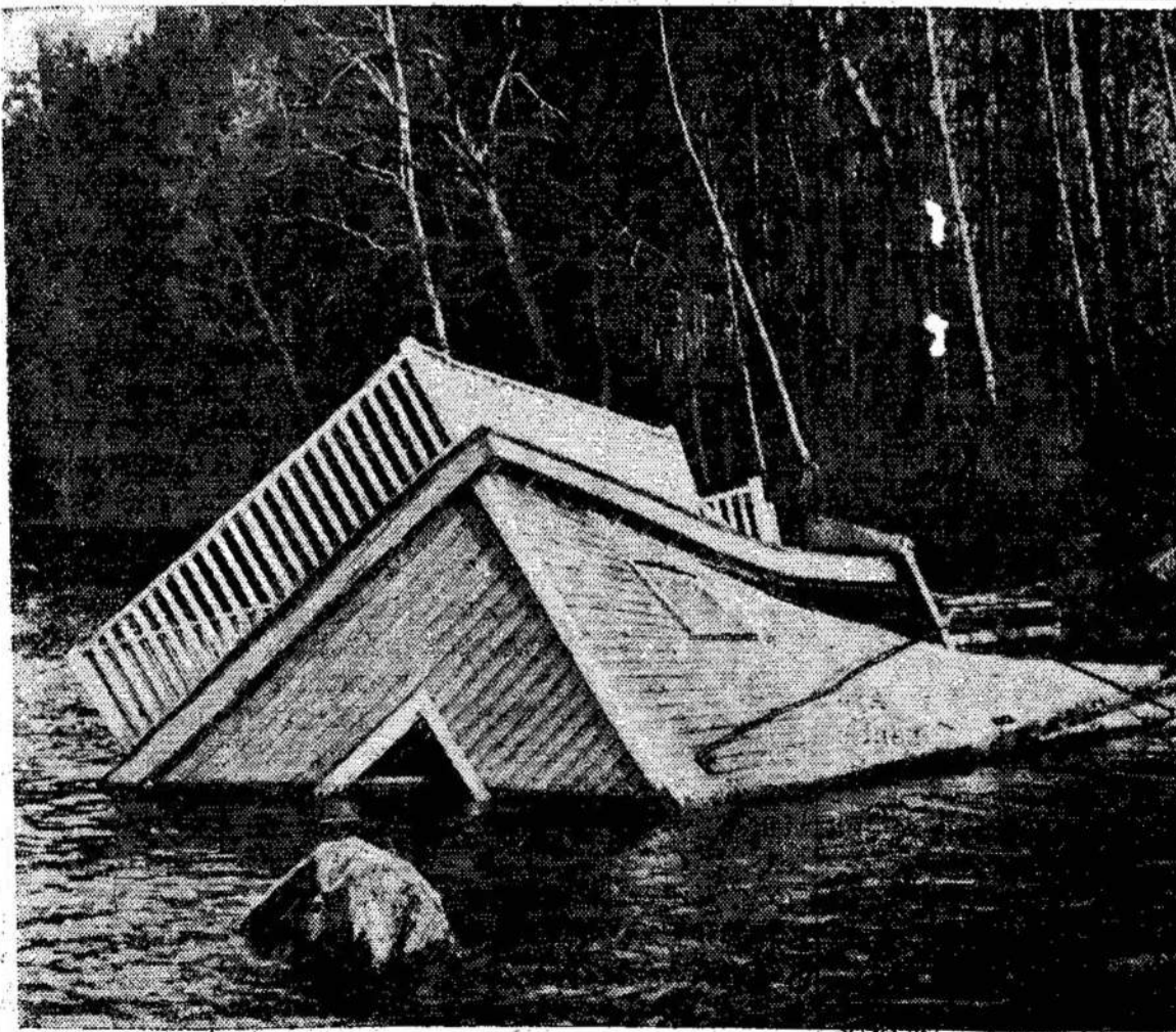
Muskoka apylinkė, kur randa- si puikiausi Kanados ku- rortai, vanduo pridarė $1,000,000 vartės nuostolių. E- paikas. Štai scena viena- žerai taip patvino, kad van- me, įs Muskoka daugybės duo apsemė kotedžius, prie- ežerų.

387 SHERMAN AVE. N. HAMILTON, ONT. Sviežias Maistas, Geras Pasirinkimas Įvairių Lietu- viškų Valgių, Turime Kambarių Apsistojimui. Savininkas Ch. Pampalas Telefonas: 46917