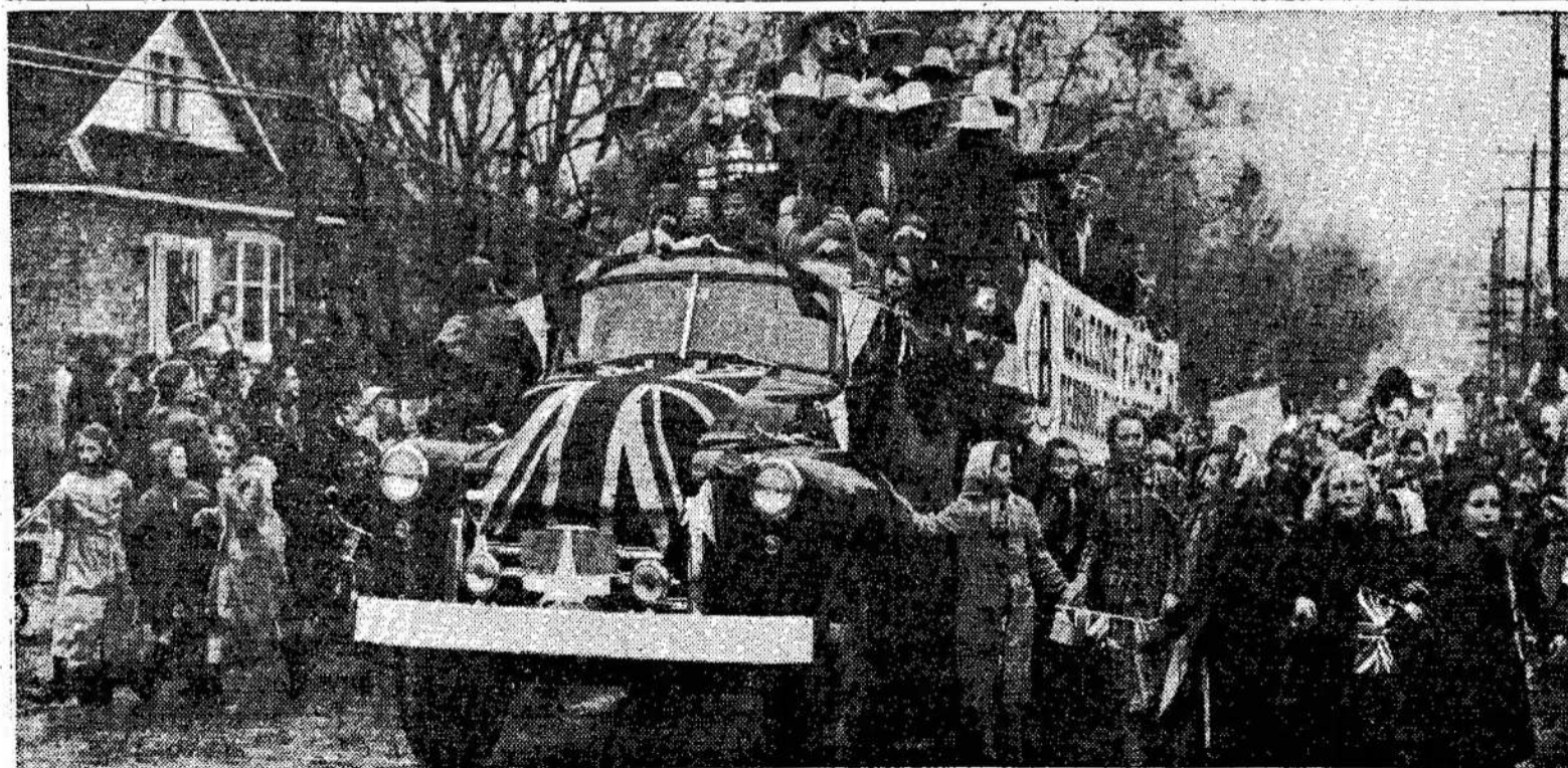
Barrie Flyers, Memorial Cup čempionai, iškilmingai su-

tinkami jiems pribuvus į Barrie. Jie smarkiai apgalė-