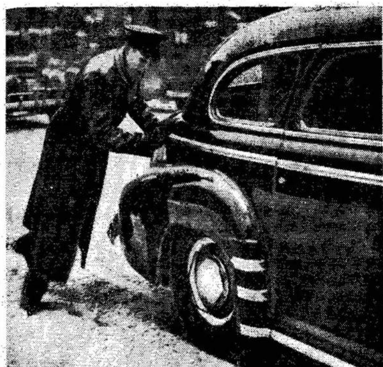
Gamta kai kada iškrečia tikrai prisnigo 16 colių sniego. Štai policija duoda "push" ir strigusiam į sniegą automobilui. Tokių scenų buvo šim-