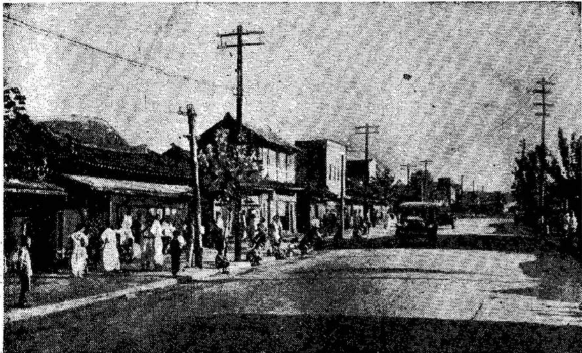
Istorinis Kaesong, kur buvo pradėtos derybos dėl baigimo karo Korėjoj. Kaesong yra senoviška Korėjos sostinė, esanti į šiaurvakarius nuo Seulo.