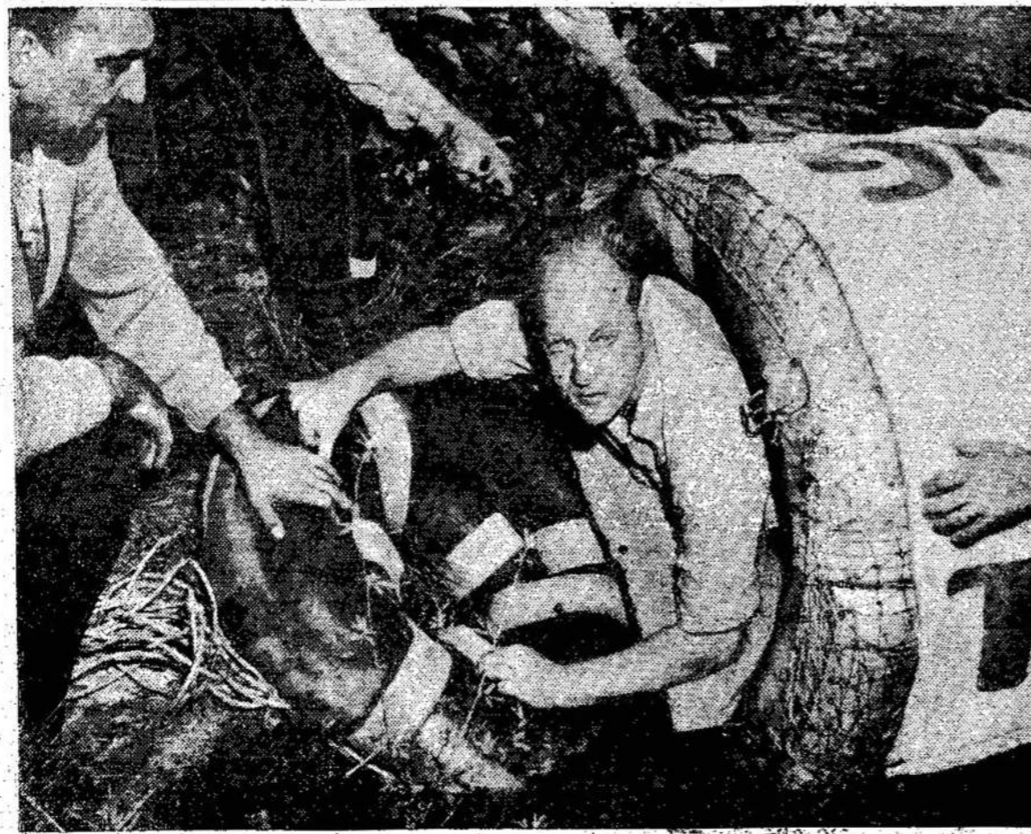
Čia matote Red Hill iškisusį bandė praplaukti Niagaros galvą iš savo prietaiso iš guminių ratų pūslių, kuriuo jis bandė praplaukti Niagaros krikli. Pasirodė, kad prietaisas neišlaikė, ko pasekoj jis zuvė: Valdžia ketina suvaržyti tokius žygius, kad tokios nelaimės nepasikartotų.