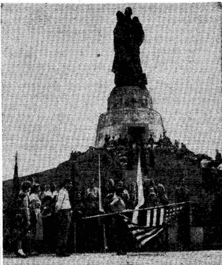
Amerikiečių jaunimo delegatai nuleidę Amerikos vėliavą prie tarybinių karių paminklo Berlyne atiduoda pagarbą tiems, kurie žuvo kovodami su naciais. Jaunimo festivalyje dalyvavo 2,000,000 jaunimo.