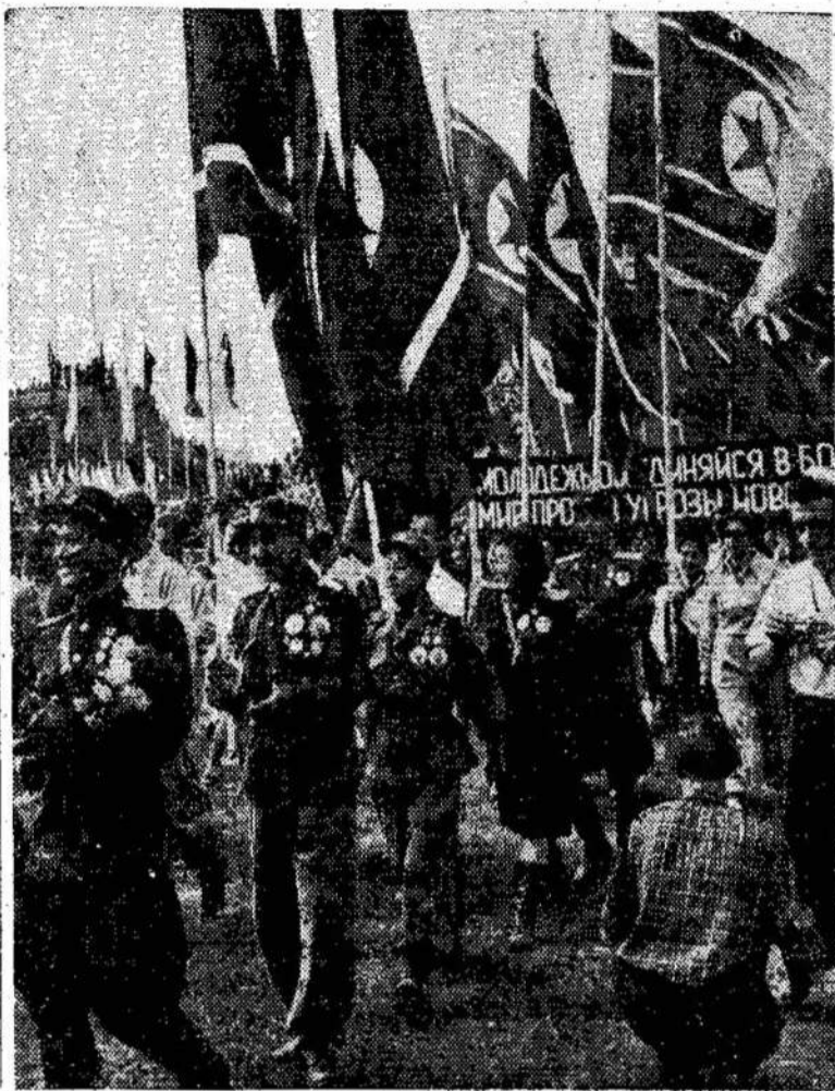
Scena iš Jaunimo demonstracijos Berlyne, baigiant tarptautinį taikos festivalį. Festivalis pasižymėjo tarptautiniu draugiškumu ir pasiryžimu ginti taiką pasaulyje. Paskutinę dieną Berlyno gatvėmis demonstravo 1,000,000 jaunuomenės. Čia matomi Kordražės delegatai.

O gerbiamas mūsų biologas, tuo laiku buvęs dalimi lietuvių tautos, atrodo ir nepagalvojo, kad užsieniuose vargsta dešimtys tūkstančių