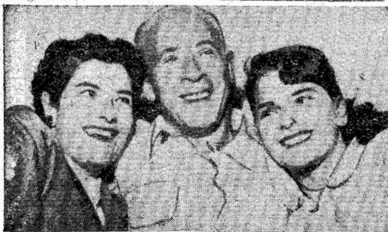
Fred Rose su savo žmona ir dukteria po išėjimo iš kalė-limo. Vyriausybė pranešė, kad jis dabar yra laisvas ir lygus kitiems Kanados pilie-

čiams, gali net kandidatuoti parlamentą, kurio nariu buvo prieš įkalinant. Pataisa pilietybės įstatyme jo nepaliečia, nes ji nesiekia praecities.