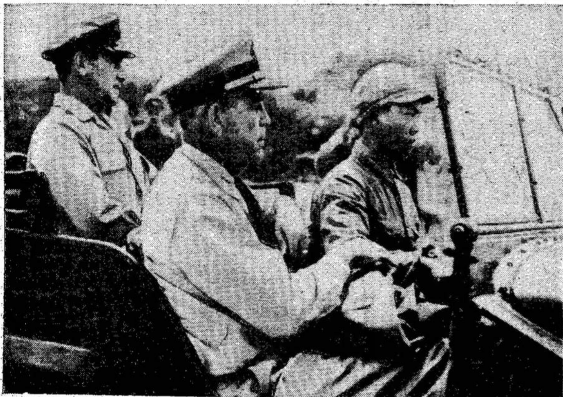
Viceadmirolas Charles Turner Joy, Jungtinių Tautų paliaubų delegacijos lyderis, ir generalmajoras L. C. Craigie (kairėj) vyksta į Kaesongą derėtis su Šiaurės Korėjos šoferis.