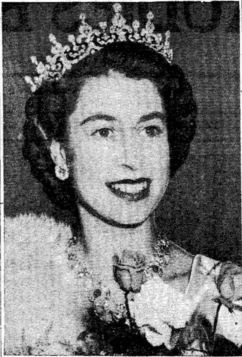
Princesė Elizabeth, kuri su savo vyru Edinburgho diuku, Quebec. Atidėjimo priežastis yra jos tėvo karaliaus atidėtas visą savaitę, tad Jurgio VI operacija.

BONN. — Vakarinės Vokietijos premjeras Adenaueris siūlo sukurti vokiečių armiją iš 250,000 vyrų, kuri tačiaus bus komandoj gen. Eisenhowerio kaip ir kitos Atlantanto Pakto armijos.