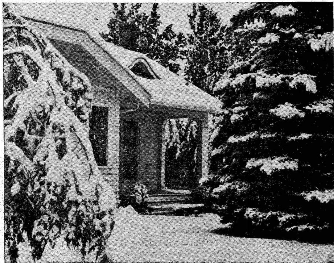
Vakarų Kanadą jau aplangė sniegas. Štai scena Lethbridge miestelyje. Sakoma, kad vakarų Kanadą jau aplangė sniegas. Štai scena Lethbridge miestelyje. Sakoma, kad

Trumano - Attlee - Schumano frontas yra išnaudotojų frontas, ginąs išnaudotojų, pavergėjų interesus. Pas juos nėra nei grūdėlio nuoširdumo, kuomet jie sako, kad jie nori taikos, tautų laisvės, demokratijos ir gero gyvenimo visiems.