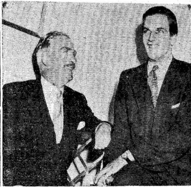
Anthony Eden, buvęs užsienio reikalų sekretorius prie Čiorčio valdžios, su savo sūnum Nicholas. Eden ir Čiornio reikalų sekretorius prie Čiorčio valdžios, su savo sūninkimus jie grįš prie galios.