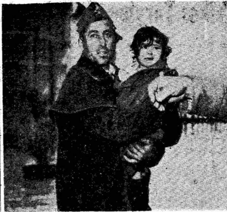
Italijoje išsiliejusi Po upė išvijo iš namų virš 200,000 žmonių. Virš 100 žmonių žuvo. Čia matote vieną sava-norį gaisrininką nešant iš apsemtų namų mažą kūdikį.