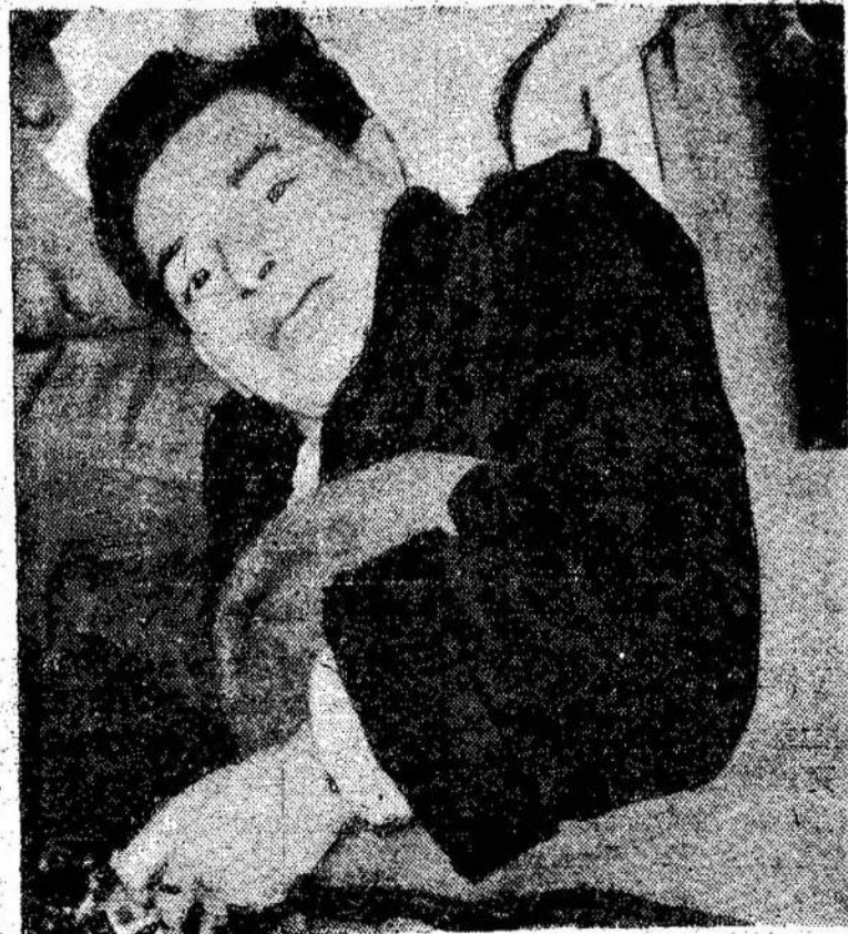
Sugrįžę iš Korėjos kanadiečiai sako, kad labai malonu vėl būti namie. Ne visi grįžo

Gruodžio 9 dieną Massey Hall (Toronte) bus puikus koncertas ir prakalbos. Tai bus delegacijos išsiuntimo į Ottawą vakaras. Jį rengia