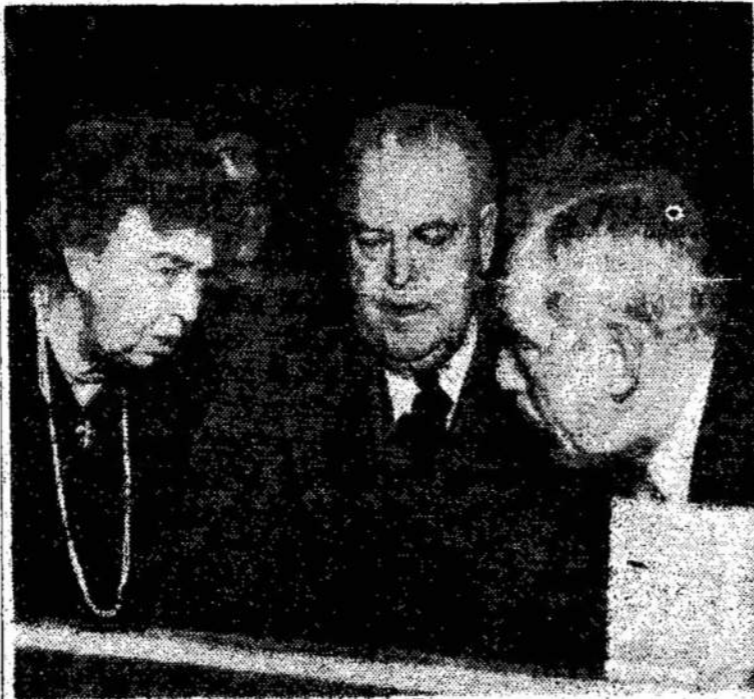
Mrs. E. Roosevelt, senatorius W. Austin ir Dean Acheson, Jungtinių Valstijų delegatai Jungtinių Tautų susirinkime Paryžiuje. Sukiše

Vargiai atsiras daug tokių, kurie kiš savo nagus į