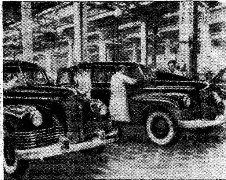
Stalino automobilių įmonės "ZIS-110", kurie sparčiai plinta ir gamybos automobiliai "ZIS-Lietuvoje.

Taip pat patvirtintas profesų sąjunginis biudžetas 1951 metams. Padidėjus profesinės sąjungos narių skaičiui, šiais metais žymiai išaugo profsąjunginės organizacijos biudžetas. Tai leidžia asignuoti daugiau lėšų kultūriniam masiniam darbui mokytojų tarpe.