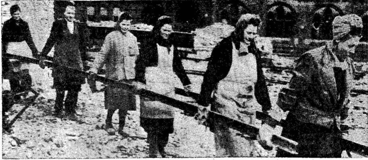
Vokietės valo griuvėsius, kurių karas paliko Vokietijoje, nepaprastai daug. Nežiūrint kiti reakcionieriai rengiasi jė nieko neišmoko praėjusio karo. Atrodo, kad jie kitiems rengiasi prieš kito karo. Atrodo, kad siame kare.