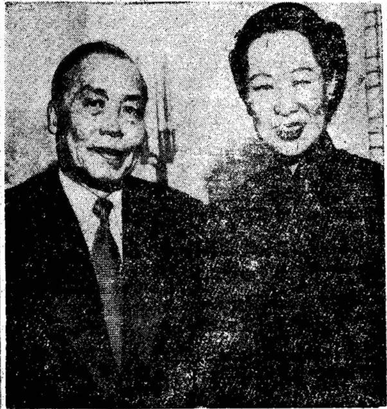
Generolas Li Tzung-Jen, buvęs Kinijos prezidentas, kurs čia matomas su savo žmona, paskelbė, kad jis rengiasi nuversti generalisimą Ciang