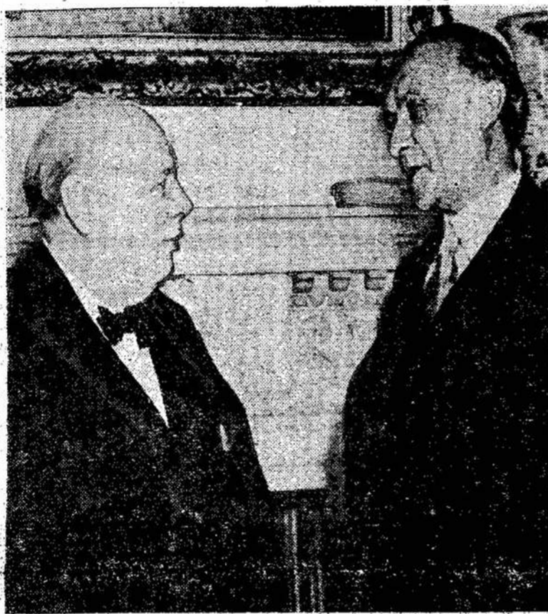
Vinstonas Čiorčilas ir Konrad Adenaueris, Britanijos ir Vakarinės Vokietijos premjerai, kurie neseniai tarėsi Londone. Baimė liaudies ju-

Visos šalys, kurios įeina į NATO (šiaurės Atlanto Sutarties Organizacija) brenda į ekonominį krizį. Ginklavimo našta neleidžia joms atsistoti ant kojų. Ir jeigu jos turės padidinti apsiginklavimą, kaip reikalauja generolas Eisenhoweris, tai tikrai jos suklups.