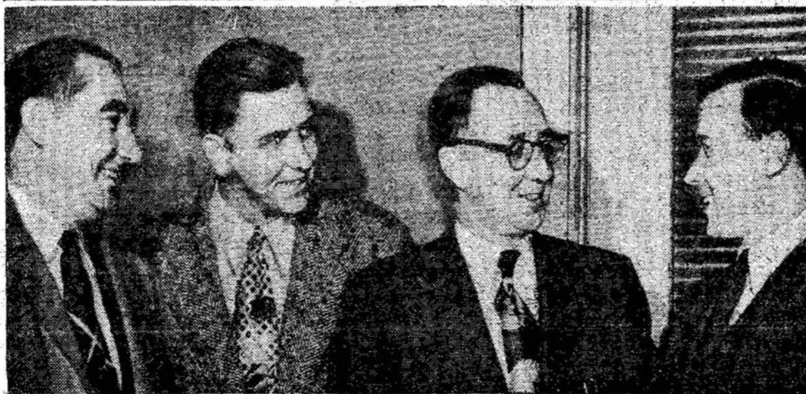
Auto darbininkų lyderiai, išlo 200 prezidentas; George zey ir Reutheris atsiskubino kairės į dešinę: Emil Mazey, Burt, unijos direktorius Kanadoje; ir Walter Reuther, tarptautinis sekretorius - iž-dininkas; Jack Taylor, loka-tarptautinis prezidentas. Ma-diskriminacija.

LLD Kanados Veikiantis Komitetas, P.O. Sta. C, Box 1007, Toronto 3, Ont.