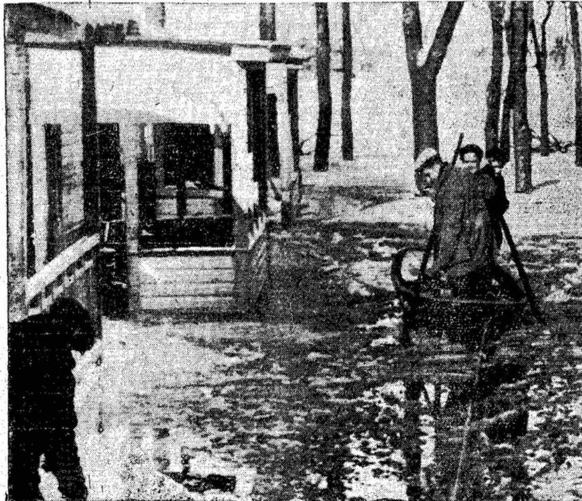
Išsiliejusi Riviere Des Prairies, Kvebeko provincijoje, išvijo iš namų 200 šeimynų.

ILLD Kanados Veikiantis Komitetas P. O. Špa. C., Box 1007, Toronto 3, Ont.