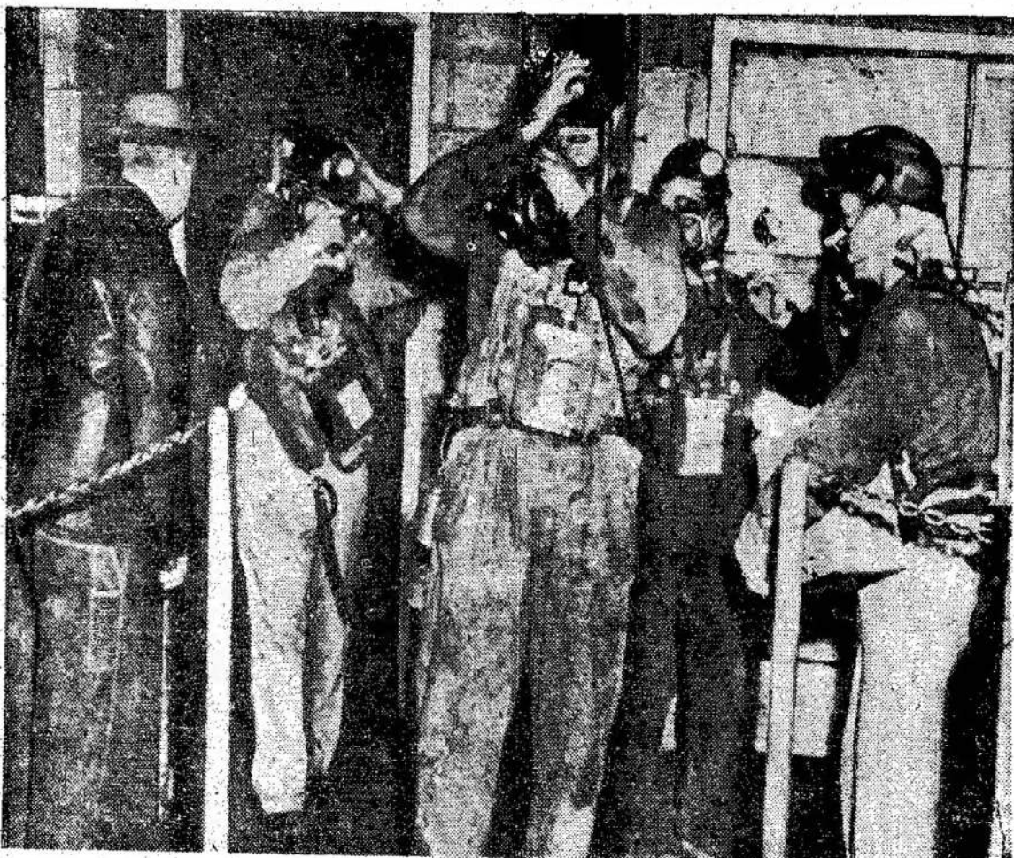
John L. Lewis (kairėj), angliakasių sąjūdžio prezidentas, prakaitavo gėdą, kai užgriūpat Kaledas, New Brankurpasitinka iš kasyklos išėjus angliakasiūs. Žuvo 119 te, Iinojaus valstijoje.