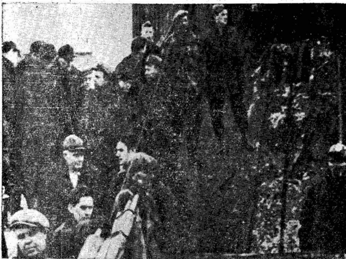
McGregor kasykloje (Stellartone, Nova Scotijoje) neseniai eksplozijoje žuvo 19 angliakasių. Čia matote vaizdą prieš kasyklos. Mainieriai ir žuvusiųjų giminės laukia išėjimo išnešant lavonus, kuriuos buvo sunku atpažinti.