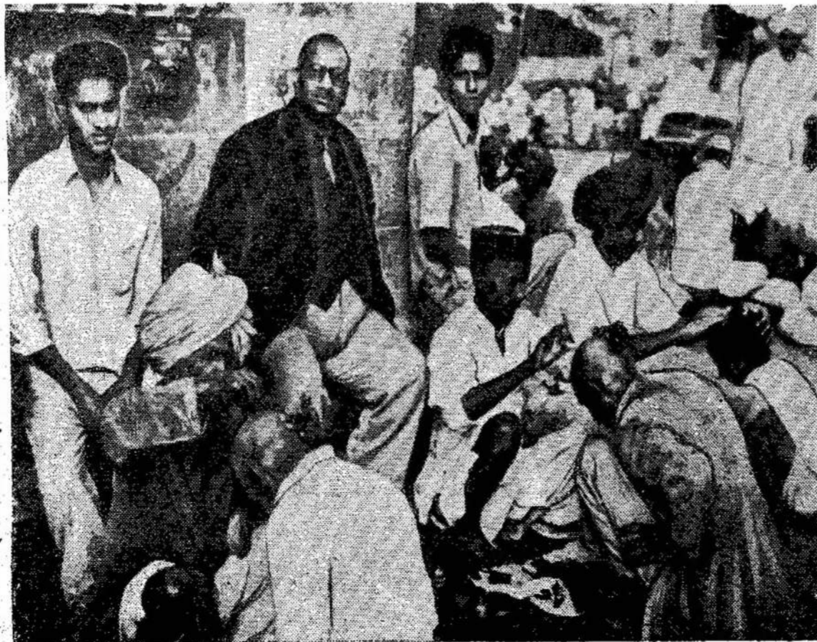
Indijos žmonės irgi liūdi ne- ekę vieno iš savo kunigaikščių. Ištikimieji, reikšdami Čia matote juos pas kirpėjus liūdėsį, nusiskuta pakaušį. ant gatvės skutant galvas.

Tokiu būdu, aišku, kad tuo metu, kai Pentagonas nenori siųsti amerikiečius į karą, kurių negalėjo laimėti tūkstančiai britų ir francūzų, bet nori palaikyti tuos visus „sąjungininkus“ kovos lauke, kyla tikras pavojus, kad gali būti einama iš vienos sta-