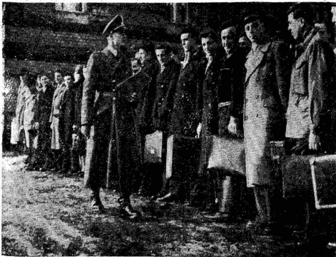
Vakarinio Berlyno policija kad atlaikyti "invaziją" iš policininką prie naujų rekrūnuolatos didinama. Girdi, Rytinio Berlyno. Čia matote tų.