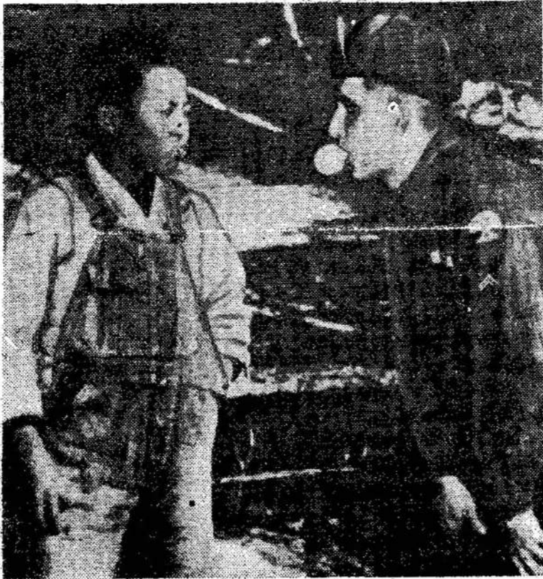
Amerikietis mokina jauną „no“ — pūsti kramtomo gukorėjietį amerikoniško „me-mo pūslę.