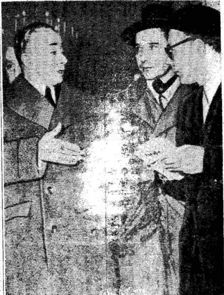
Francijoj įvyko valdžios krizis. Buvo siūlyta ponui Paul Raynaud (kairėj) sudaryti valdžią, bet jis negalėjo. Paskui buvo paskirtas tūlas Pinay. Jis šiaip taip, su neku-

JAV ginklavimuisi išlaidos yra milžiniškos ir dar vis didinamos. Po Antrojo Pasaulinio Karo, ligi 1950 m. antro pusmečio, JAV išleisdavo tik po keliolika milijonų dolerių karo bei ginklavimosi reikalams, o 1950 metų vien paskutinių trijų mėnesių laikotarpyje jau išleido 20 milijonų dolerių, laike pirmų devynių mėnesių 1951 metų jau išleido $96,200,000,000. Tuo tarpu, kada tokiais šuoliais kilo ginklavimosi bei karo išlaidos, tai beveik lygiagrečiai didėjo bedarbių skaičius ir žmonių biednėjimas. Apie tą liūdiąja civiliams reikalams gaminių susikaupimas. Jei 1950 m. liepos mėn. JAV sandėliuose buvo $53,200 milijonų vertės gaminių, tai 1951