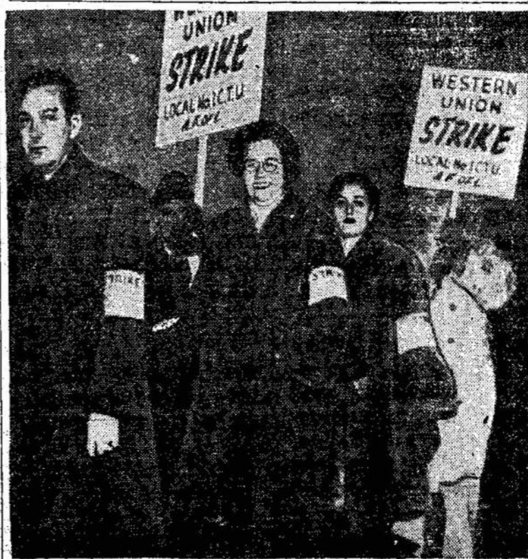
Telegrafo darbininkai Chicagoj ir kituose miestuose streikuoja už pakėlimą algų. Čia matote pikietininkus.