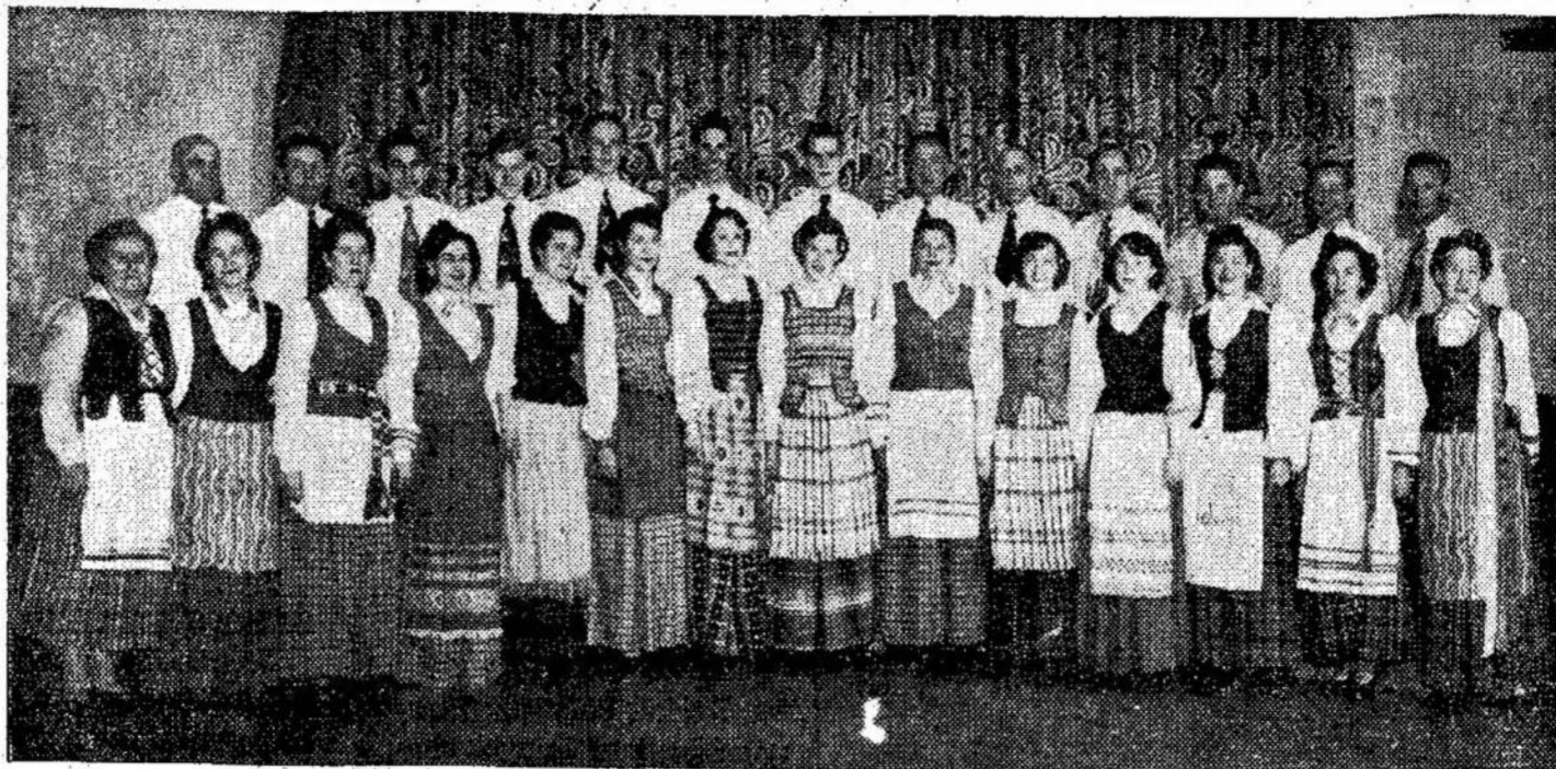
Bangos choras, kuris savo veikimu yra nudirbęs daug gražaus kultūrinio darbo Toronte. Jo dainomis, jo surengtais koncertais, jau daug kartų, per metų metus, torontiečiai ir kitų kolonijų lietuviai

Jau seniai nustojo lojė šunes. Sodžiuje pragydo tretis