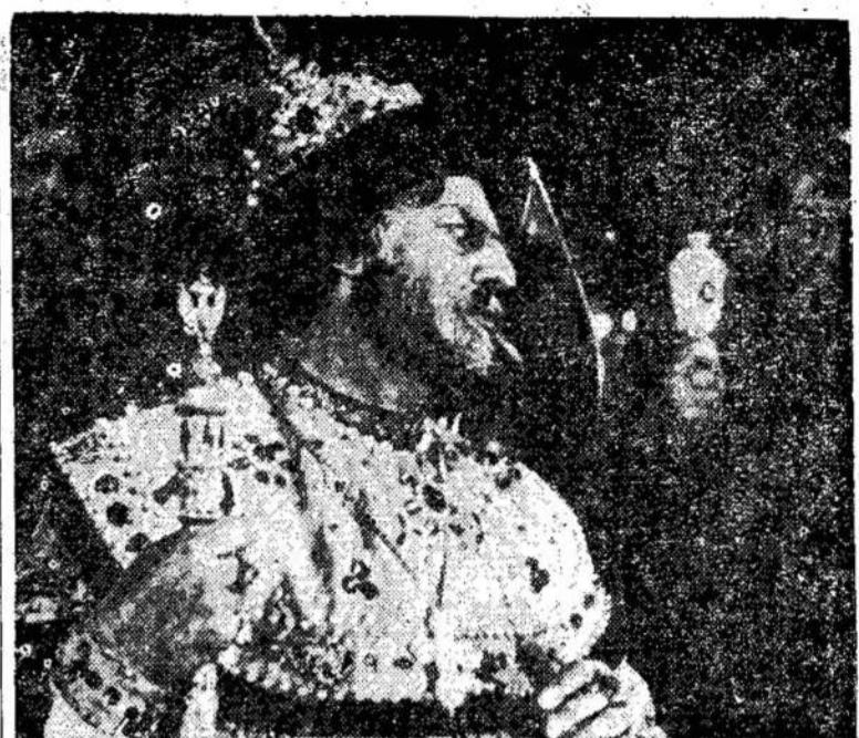
Scena iš tarybinės filmos "Mussorgsky", kuri rodoma Studio teatre, College ir Manning, Toronte.

Naujas judėjimas prieš graftą ir korupciją Kinijoje pastaruoju laiku atgavo netikėtai didelį kiekį vaistų, paklodžių, audeklo ritimų ir sauso pieno (paversto miltais). Valdžia sako, kad tas viskas buvo išnešta iš prieglaudos.