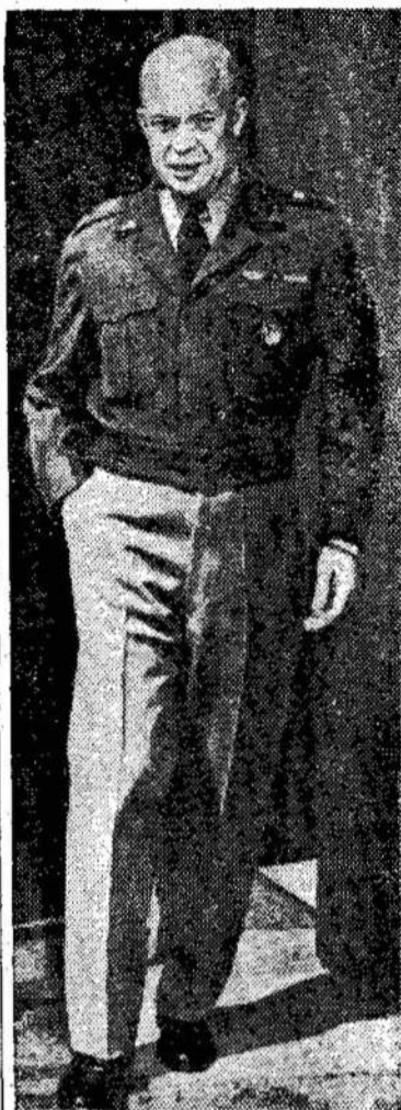
Generolas Eisenhoweris, kuris rengiasi aplieisti NATO ir mestis į prezidentinę kovą namie. Atrodo, kad jis turi daugiau pritarėjų tarp republikonų.