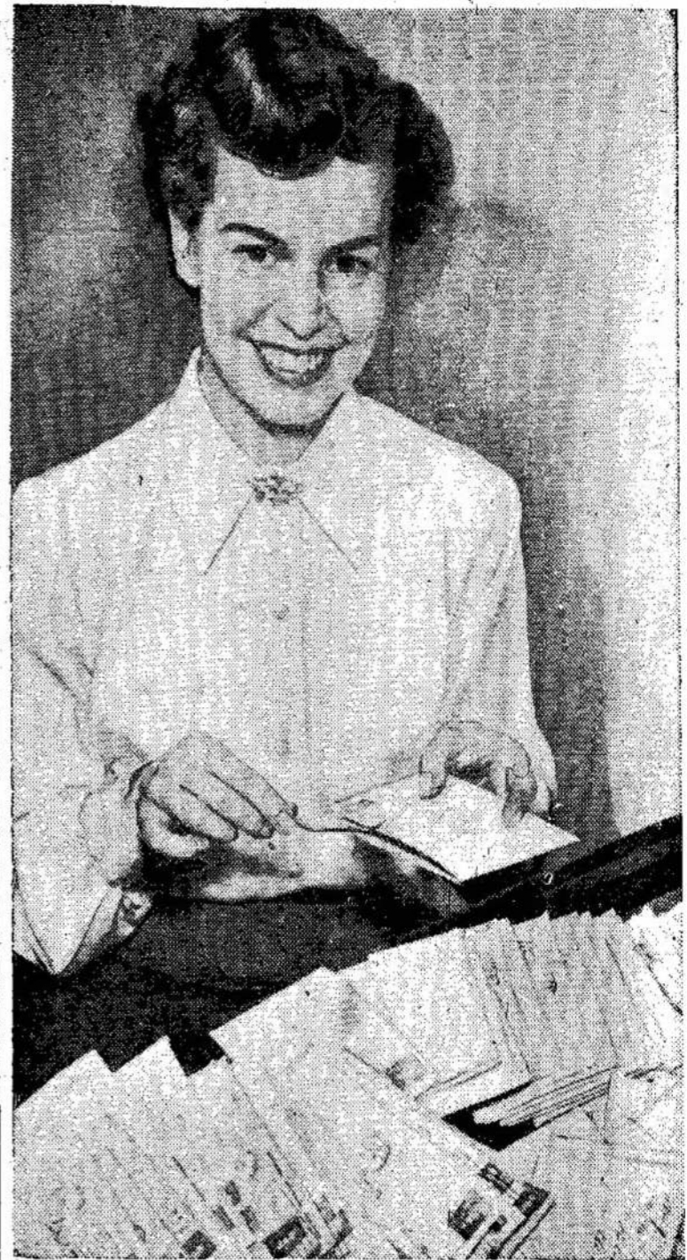
Kanados valdžia išgudrėjo. Būdavo neišrenka iš taksų mokėtojų algų visų taksų, tad žmonės pykdavo, kai gale metų reikėdavo dar primokėti. Dabar ji išrenka daugiau ir didžiumai gražina permokėjimus gale metų. Čia matote vieną iš raštininkų, prirengiančių čekius.

Pagalvokit patys: jei jūs būtumėt suimti, ar jūs netikėtumėt teisingumu, jei jus teistų trys asmenys, kuriuos jūs, jūsų šeima ir jūsų draugai pažįsta? Tokie pat žmonės, kaip ir jūs. Šale to, ar dėl to, visi tarybiniam teismui jaučiasi laisvi. Tenai nėra "kalinio suolo" ir įtemptos atmosferos. Teismas, kuriame mes buvome, išrodė kaip paprasta susirinkimų salė. Ir teismai buvo daugiau kaip "susirinkimai", negu